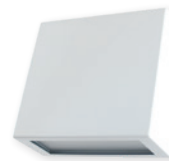
weiß (WS) RAL 9016 finish in white (WS) RAL 9016

Alle Angaben beziehen sich auf 1,0 m Abstand zur Rettungswegmitte.