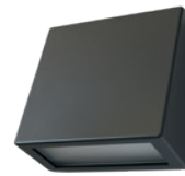
anthrazit (AZ) RAL 7016 finish in anthrazit (AZ) RAL 7016