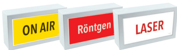
Ausführung mit Sonderpiktogramm version with special pictogram