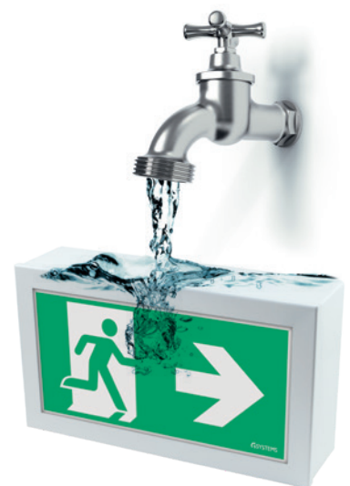
optional: Ausführung in IP65 option: finish in IP65