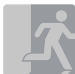
SONDER- PIKTOGRAMME SPECIAL PICTOGRAMS