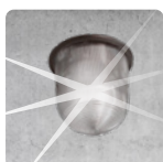
SIGNALLEUCHE LED-BLITZ SIGNAL LUMINAIRE LED-FLASH