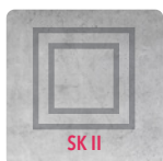
SCHUTZKLASSE II PROTECTION CLASS II

gemäß RABT / EABT according to RABT / EABT