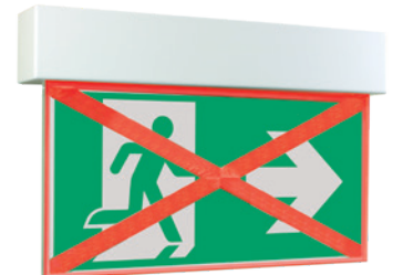
Fluchtweg gesperrt escape route blocked