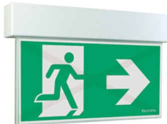
Fluchtweg freigegeben escape route approved